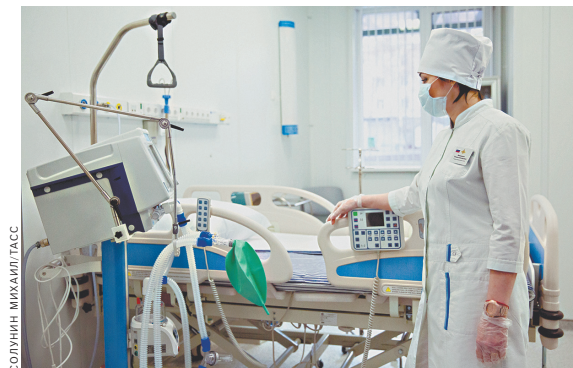
Госпиталь готов к приему пациентов.

17 апреля замминистра обороны РФ Тимур Иванов доложил президенту РФ об окончании строительства военного медцентра на 60 коек площадью в 5,5 тысячи квадратных метров в Нижнем Новгороде на территории 422-го военного госпиталя Западного военного округа. Строительство заняло всего 28 суток. Учреждение предназначено для оказания помощи по диагностике и лечению больных с различными инфекционными заболеваниями. По его словам, медцентр полностью обеспечен необходимым медицинским оборудованием, в том числе аппаратами искусственной вентиляции легких, компьютерным томографом, рентгеном, аппаратами УЗИ, а все медицинские работники обеспечены средствами индивидуальной защиты в полном объеме. Центр в Нижнем Новгороде — первый из 16, которые в конце марта строятся в четырех военных округах. На их строительство из резервного фонда правительства РФ выделено почти 9 миллиардов рублей.