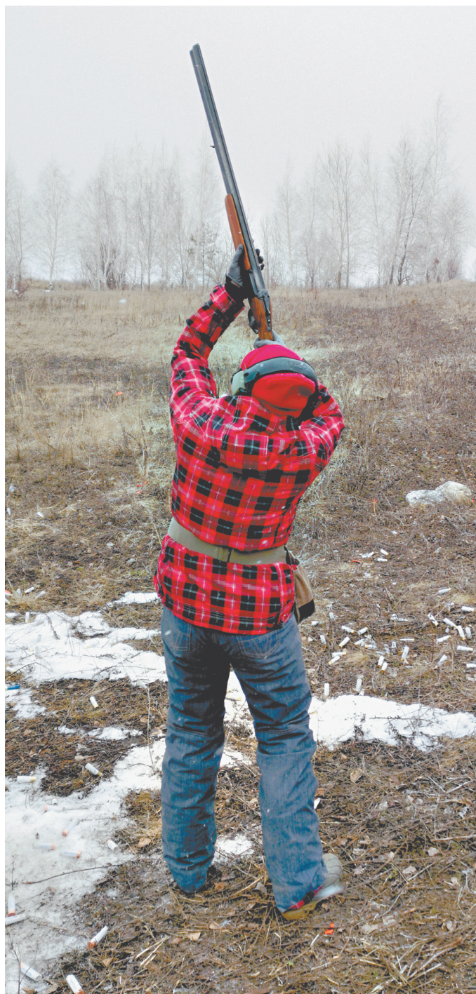
Сбитые на зимних тренировках тарелочки для многих самарских охотников могут оказаться единственным трофеем в этом году.

— Как только ввели режим самоизоляции, я распустил своих сотрудников и написал охотникам, что деньги за путевки можно перевести на счет предпри-